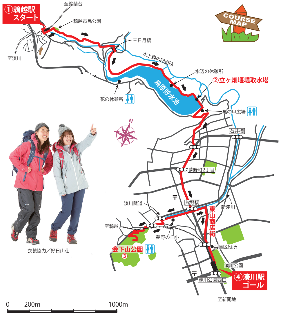
衣装協力/好日山荘